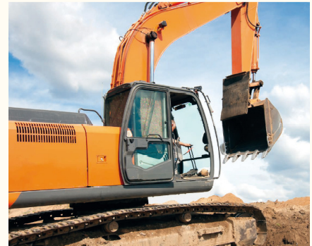
La pelle hydraulique