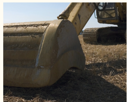
La pelle rétrocaveuse