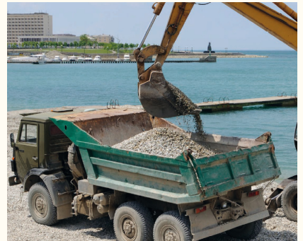
Le camion à benne