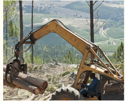
Le débardeur à pinces