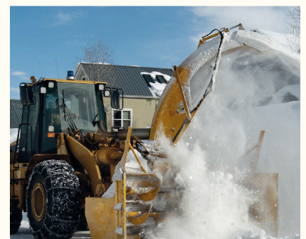
La souffleuse à neige