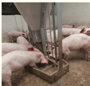
La trémie d'alimentation