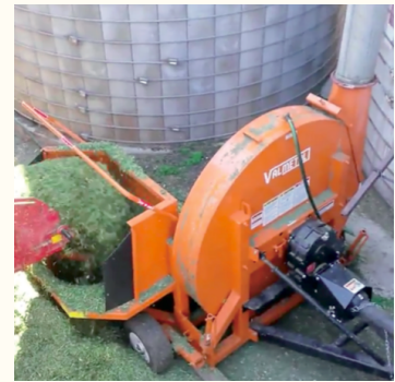
La souffeuse à fourrage