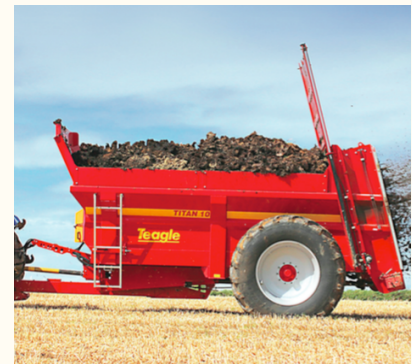
L'épandeur à fumier