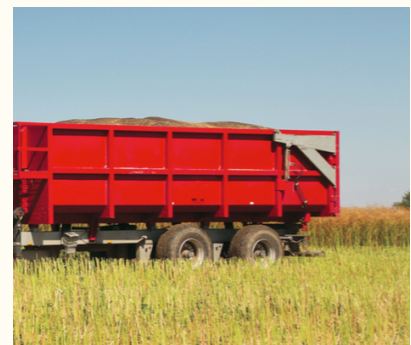
La remorque agricole