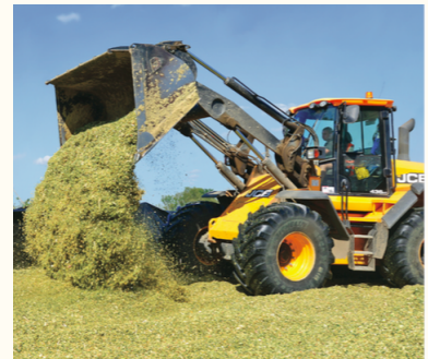
Le chargeur frontal