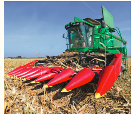
Le cueilleur à maïs