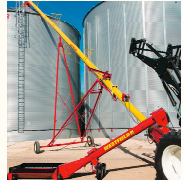
La vis à grain