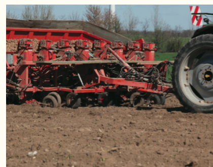
La planteuse de pommes de terre