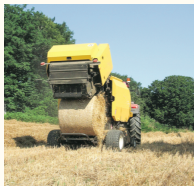
La presse à balles