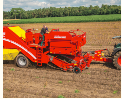
La récolteuse de pommes de terre