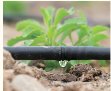
Le système goutte-à-goutte